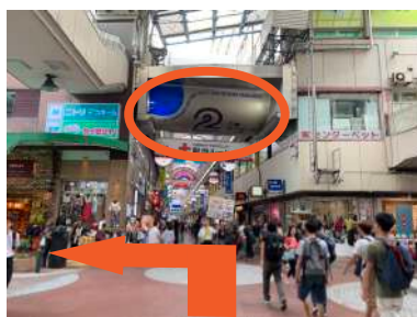
⑤ 頭上に2丁目の大看板が見えた所で、左に曲がります。