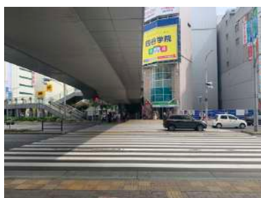
② 信号を渡り、直進します。