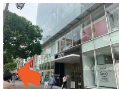
③ マルイの前を進みます。