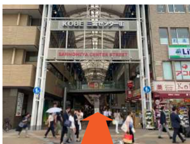
④ 右側の三宮センター街に入ります。