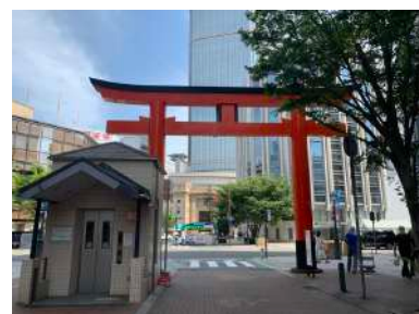
⑥ 鳥居をくぐり、直進します。