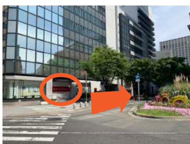
⑦ 神戸信用金庫右側の通りに入り、150mほど進みます。