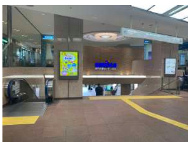
① 西口改札を左に進み、エレベーターをおります。