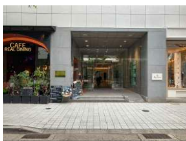
⑧ 1階にデンマーク国旗のカフェが入っているビルの5階です。