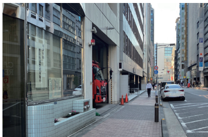
④ 消防署側の道路を直進します。