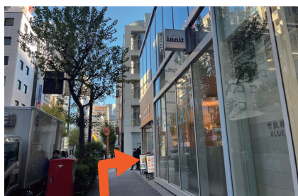
⑦ カフェinnitの角を右折します。