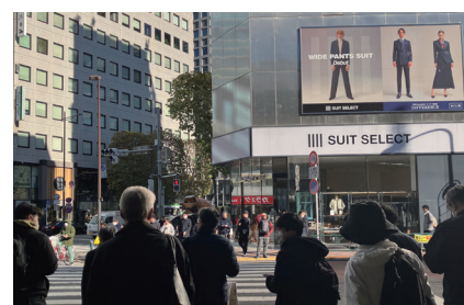
③ 銀座口を出て目の前の信号を渡ります。(SUIT SELECT方面)