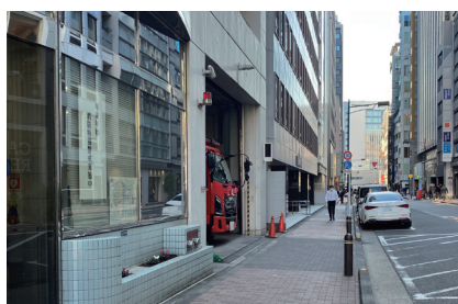
⑧ 消防署側の道路を直進します。