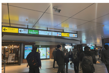
② 改札を出て右の銀座口へ進みます。