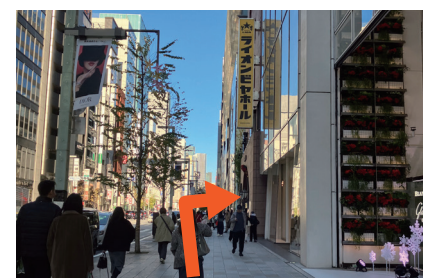
⑥ ライオンビヤホールで右折します。