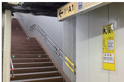
① A1番出口の階段を上ります。