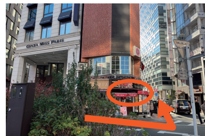
③ 左手のMISS PARISを過ぎて赤いシェードのカフェのある角を左折します。