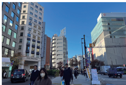
② MISS PARISを左手に見ながら直進します。