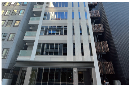
⑤ GINZAカムイビルというビルがあり、その7階がオフィスです。

※ご来社の際には[701]を押した後に[呼出ボタン]を押してお呼び出しください。