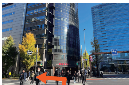
④ そのまま直進し、宮越屋珈琲に向かって信号を渡り左折します。