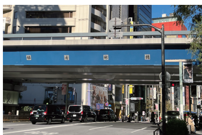
⑤ ファミリーマート側の通路をそのまま直進します。銀座新橋の下を直進します。